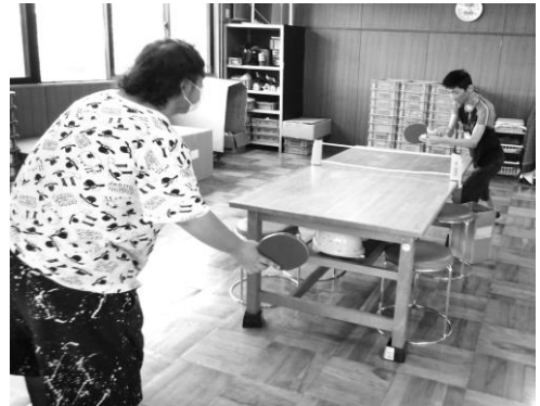
「卓球を楽しんでいます！」

このコロナ禍で、マスクの寄付もたくさんいただきました。みなさまの心温かいご支援に大変感謝しております。ありがとうございました。(T)