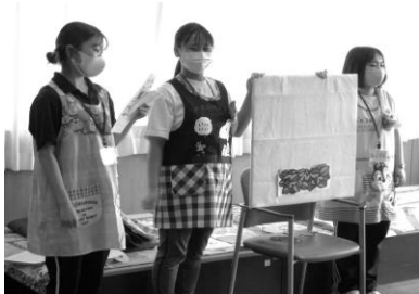
「実習生による活動風景」