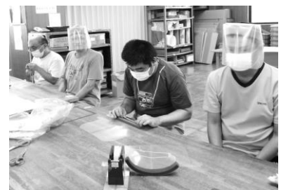
「フェイスシールド作り」

フェイスシールド作りはファイルを切り抜き、スポンジやシリコンゴムをつけて完成！みなさん楽しく作成してくれました。コロナ感染予防として使っていただければと思います。また、施設内の非常口と消火器の場所をグループで協力して探すことで防災に興味を持ってもらえる良い機会になったと思います。(Y)