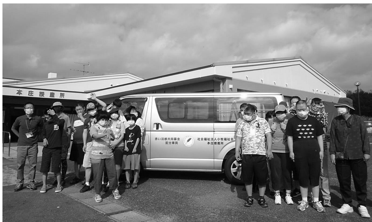
「ハイエースが納車されました!!」

当法人は、赤い羽根共同募金について、毎年ふれあいまつりの会場等でご協力をお願いしておりましたが、今年は中止せざるを得なくなりました。なお、各事業所には募金箱が設置してありますので、ご協力をお願いいたします。(I)