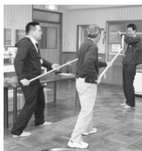
「さすまたの使い方講習」