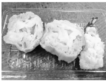
「天ぷらのサンプル作り」