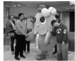
「こまちゃんと握手」