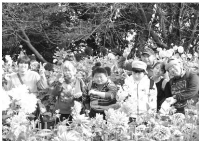
「なばなで記念撮影」

郡上方面は、天ぷらとレタスのサンプル作りを体験。その後はグループによって城下町の散策、お城見学、道の駅内の足湯などいろいろな経験をしてきました。