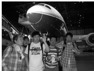
「ボーイング機前にて」

また、自分が折った紙飛行機をライトが当たる中に飛ばしたり、飛行機の絵を塗ると、それが映像に写し出されるなどさまざまな体験を楽しむことができました。