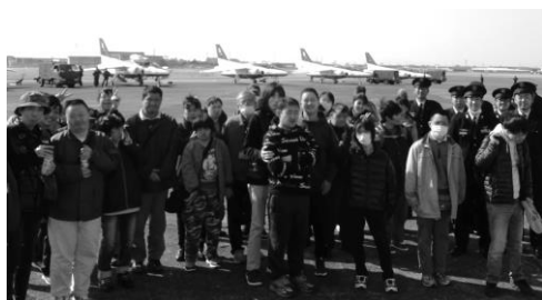
「ブルーインパルス事前訓練に参加」

航空自衛隊よりお誘いをいただき、生活介護班で小牧基地オープンベース前日見学会（ブルーインパルス事前訓練）に参加してきました。大迫力のエンジン音とともに力強く空へと飛び立ち、大空を自在に動く姿にみんな目を輝かせていました。