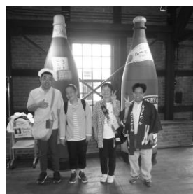
「幻のカブトビール」

魚太郎で美味しい昼食を食べた後は赤レンガ建物へ。歴史ある建物をバックに記念撮影して、お土産や大好きなビールを買い求めるなど思い思いの時間を過ごしました。当日フライト・オブ・ドリームズでは、入館者100万人目が出ていました。新しい体験型の施設と歴史を感じる建物を同時に見て、時の流れを感じる事ができた一日でした。(T)