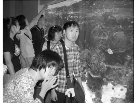
「どんな魚がいるかな？」