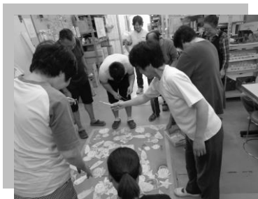
魚釣りゲーム中です。 何匹釣れるかな～？

いろいろな活動を通して、仲間同士の親睦が深まり、声を出して笑ったり、みんなな作業とは違う顔が見られています。（K）