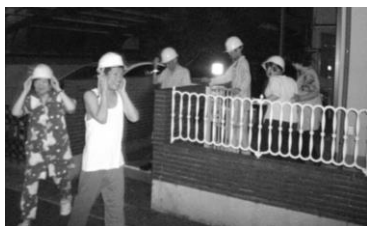
「頭を守ってみんなを外に！」