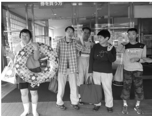
「プール行ってきま〜す！」

残暑厳しい日々が続き…何よりのプール日和!!今年も希望者を募って行って来ました。