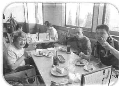
「コハルカフェでティータイム！」