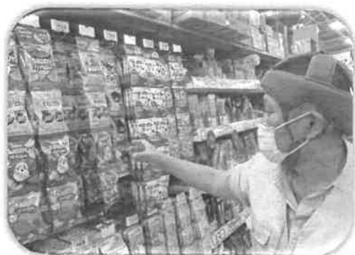
「ドン・キホーテでお買い物♪」