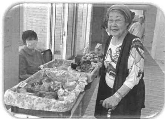
「寄ってらっしゃい！見てらっしゃい！」

今年度から毎月定例の老人福祉センターバザーは「田島の郷」で開催しています。授産所からも近くなり、顔見知りのお客様もちらほら。新規のお客様も大歓迎なので、気軽にのぞいて下さいね。長きに渡りお世話になりました「野口の郷」のみなさま、温かなサポートをたくさんありがとうございました。「田島の郷」のみなさま、これからよろしく願いいたします。(O)