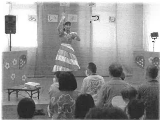
「えみちゃんのステージ」

5月18日(土)に第14回い わざきふれあいまつりを開催し ました。コロナの予防に留意しな がら以前と同様の規模で開催し、 大いに盛り上がりました。当日は 来賓の方や近隣の方々には多数 来場していただきました。ハッピ ースマイルコンサートから盛大 に幕が開き、小牧のキャラクター のこまき山・こまちゃんも登場！会 場を盛り上げてくれました。