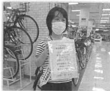
「レシート集めます」

このキャンペーンは、集まったレシートの合計金額の1%相当分をイオン様より寄附としていただき、活動に必要な物品に交換しています。これからも大きな声で参加したいです。(H)