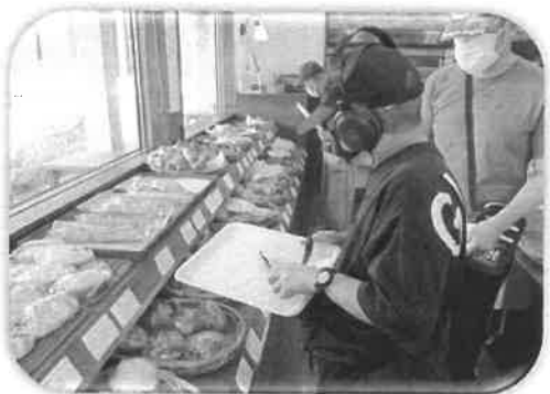
「ボンパナでパンを選んでます！」

外出に制限のあったコロナ禍では、思い切り外出を楽しめずにいました。5類移行から1年が経ち、授産所のグループ活動でも喫茶店やパン屋さんなど、飲食できる場所にも立ち寄って楽しめるようになりました。みんなの帰ってきた時の笑顔が印象的でした。(K)