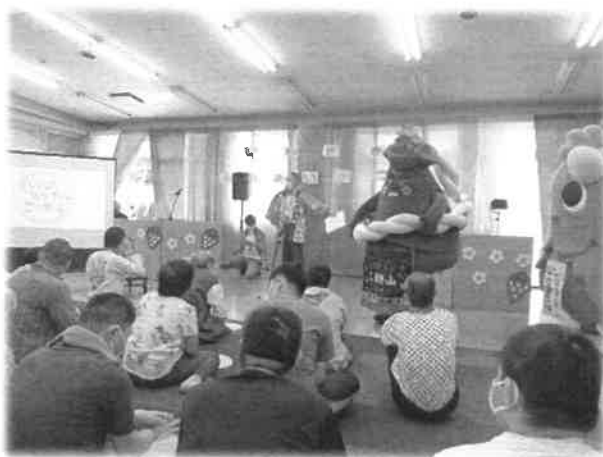
「こまき山とこまちゃん参上!!!」

無事にまつりを開催できたのは、 多くのボランティアさんのご協力 のおかげです。あわせて、協賛して いただいた企業様、余剰品を提供して いただいた地域のみなさまに深く感謝 いたします。ありがとうございました。 (T)